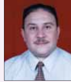
بقلم: خالد بيومي

عند توصيل خزان الوقود بالماكينة تنشأ مشكلات مهمة للمحافظة على جزء مهم من أجزاء الماكينة وهي مضخة حقن الوقود. وقد اختلفت الأساليب في هذه الطريقة وكانت تابعة من اجتهادات المزارعين، وكانت جيدة، ولكن كان ينقصها بعض النقاط البسيطة التي لم تؤخذ في الاعتبار وقد تؤدي إلى مشكلة كبيرة.