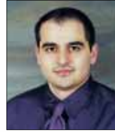
بقلم: عودة محمد إداري نظام الحاسوب الشخصي

سأحاول في هذا المقال استكشاف وتوضيح ما يحدث حقيقة وراء شاشات حواسيبنا الشخصية المشاهدة، خصوصاً عندما يحاول المستخدم الحصول على بريد إلكتروني أو العمل على برنامج الشركة أو حتى طباعة المستندات على الشبكة. إن شبكات الحواسيب هي القوة الدافعة وراء معظم تعاملات الحواسيب وبرامجها اليوم، ومن جانب آخر فهي تجعل تعاملات الأعمال التجارية والاتصالات أكثر سرعة وكفاءة ودقيقة للغاية.